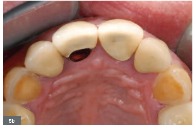
Fig. 5. Patient de 53 ans présentant des lésions érosives d'origine intrinsèque. 5a. Vue de face en occlusion ; les lésions sont masquées par les couronnes sur les incisives maxillaires. 5b. Vue occlusale mettant en évidence des signes d'usure sur les canines maxillaires. Ces lésions, rares chez les hommes (10 %), sont pathognomoniques d'une anorexie-boulimie nerveuse, partiellement avouée lors de l'anamnèse.

Fig. 5. 53-year-old patient presenting with erosive lesions of intrinsic origin. 5a. Front view in occlusion; the lesions are hidden by crowns on the maxillary incisors. 5b. occlusal view highlighting signs of wear on the maxillary canines; these lesions, rare in men (10%) are pathognomonic of a nervous anorexia/bulimia, partially acknowledged during the anamnesis.