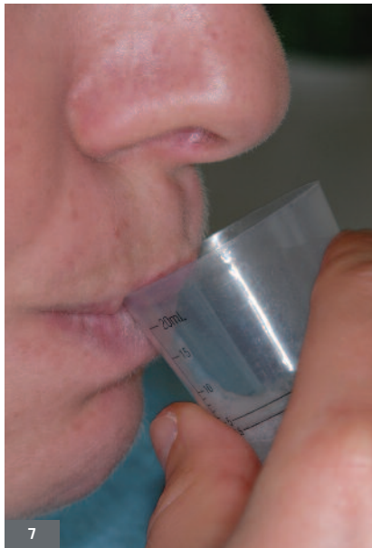
Fig. 7. Recueil de la salive pendant un temps donné afin de quantifier le débit du flux salivaire. Lorsqu'il n'est pas stimulé, il est normalement compris entre 0,3 et 0,4 ml/min.

Fig. 7. Saliva collection during a specified period of time to measure the salivary flow rate. When it is not stimulated, it generally ranges between 0,3 and 0,4 ml/min.