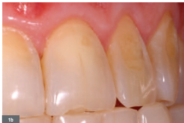
Fig. 1. Usure érosive d'origine extrinsèque (consommation de citron en quartiers), localisée sur la face vestibulaire des incisives et canines maxillaires d'une patiente de 57 ans. 1a. La latéralisation manuelle du brossage (usure abrasive) est responsable de l'asymétrie des lésions. 1b. Les lésions érosives sont concaves, avec un bandeau d'émail présent à la périphérie. La présence de tâches atteste l'ancienneté du processus érosif, qui n'est plus actif.

Fig. 1. Erosive wear of extrinsic origin (consumption of lemon wedges), localized on the vestibular face of the maxillary incisors and canines in a 57-year-old patient. 1a. The manual lateralization of tooth brushing (abrasive wear) has caused the asymmetry of the lesions. 1b. The erosive lesions are concave, with a strip of enamel in the periphery. The presence of stains shows the age of the erosive process, which has ceased to be active.