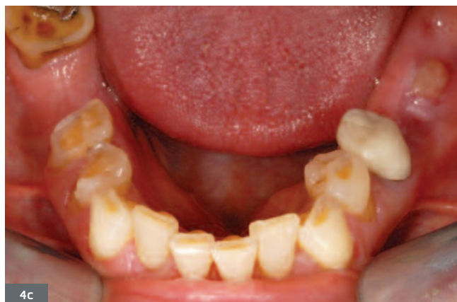
Fig. 4. Importantes lésions érosives liées à un reflux gastro-œsophagien chez une patiente de 66 ans. 4a. Vue de face en occlusion : les lésions sont quasiment indiscernables. 4b. Vue occlusale maxillaire mettant en évidence d'importantes lésions érosives d'origine intrinsèque. 4c. Vue occlusale mandibulaire ; l'asymétrie des lésions pourrait indiquer que le reflux se produit pendant le sommeil.

Fig. 4. Extensive erosive lesions due to gastroesophageal reflux in a 66-year-old patient. 4a. Front view in occlusion; the lesions are almost invisible. 4b. Maxillary occlusal view highlighting extensive erosive lesions of intrinsic origin. 4c. Mandibular occlusal view; the asymmetry of the lesions could indicate an occurrence of the reflux during sleep.