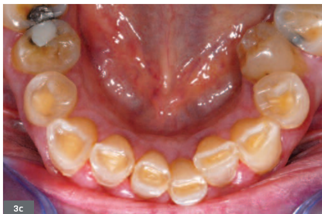
Fig. 3. Importantes lésions érosives liées à un reflux gastro-œsophagien chez un patient de 78 ans. 3a. Vue de face en occlusion : l'usure vestibulaire (en particulier sur 11 et 12) atteste une origine mixte de l'érosion, intrinsèque mais également extrinsèque. 3b. Vue occlusale maxillaire : les pulpes sont presque atteintes. 3c. Vue occlusale mandibulaire : la marge entre l'émail et la dentine est liée au différentiel de minéralisation, et donc d'usure, de ces deux tissus.

Fig. 3. Extensive erosive lesions due to gastroesophageal reflux in a 78-year-old patient. 3a. Front view in occlusion; the vestibular wear (particularly on 11 and 12) shows the mixed origin of the erosion, both intrinsic and extrinsic. 3b. Occlusal maxillary view; pulps are almost affected. 3c. Mandibular occlusal view; the margin between the enamel and the dentin is due to the difference of mineralization and consequently of wear, in these two tissues.