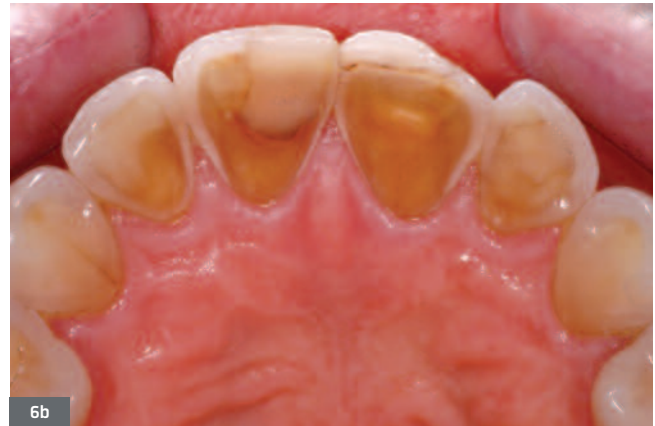
Fig. 6. Patiente de 28 ans présentant des lésions érosives d'origine intrinsèque. 6a. Vue de face en occlusion ; les lésions érosives ne sont pas visibles sur les faces vestibulaires. 6b. Vue occlusale mettant en évidence les lésions associées à une boulimie nerveuse. La perte de substance amélaire est liée au frottement de la langue sur les faces palatines fragilisées par l'attaque acide liée aux vomissements chroniques. Les termes perimolysis ou perimylolysis sont utilisés dans la littérature anglo-saxonne pour nommer cette forme d'usure spécifique.

Fig. 6. 28-year-old patient presenting with erosive lesions of intrinsic origin. 6a. Front view in occlusion; the erosive lesions are not visible on the vestibular faces. 6b. Occlusal view highlighting the lesions associated with bulimia nervosa. The loss of the enamel substance is due to the friction of the tongue on the palatal faces weakened by the acid attack caused by chronic vomiting. The terms "perimolysis" or "perimylolysis" are used in the Anglo-Saxon literature to name this type of specific wear.